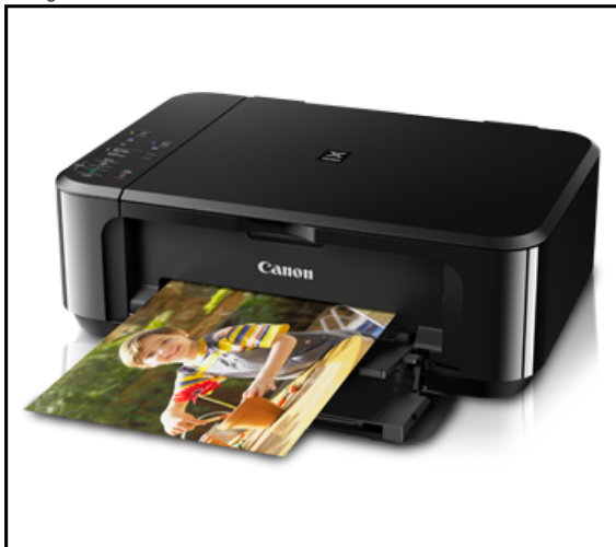
Ảnh chỉ mang tính chất minh họa